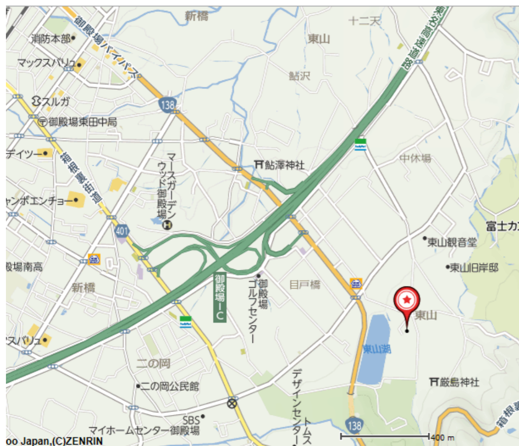
位置図 御殿場市東山1064-4他